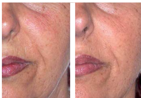
Ošetření obličejových vrásek Před AWT® Po AWT®