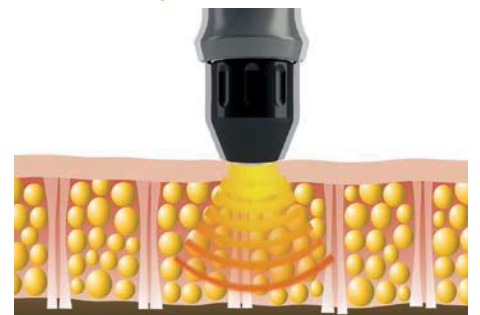
Přenos akustických vln do kůže