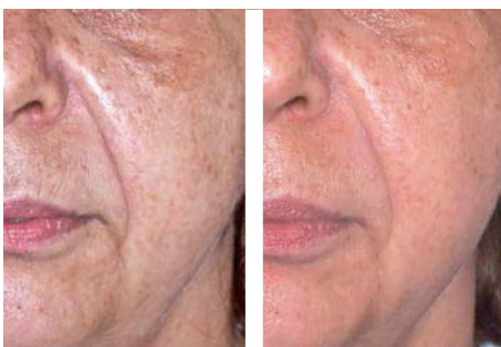
Ošetření obličejových vrásek Před AWT® Po AWT®