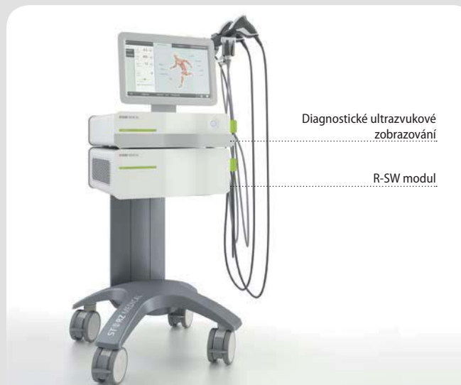
Diagnostické ultrazvukové zobrazování